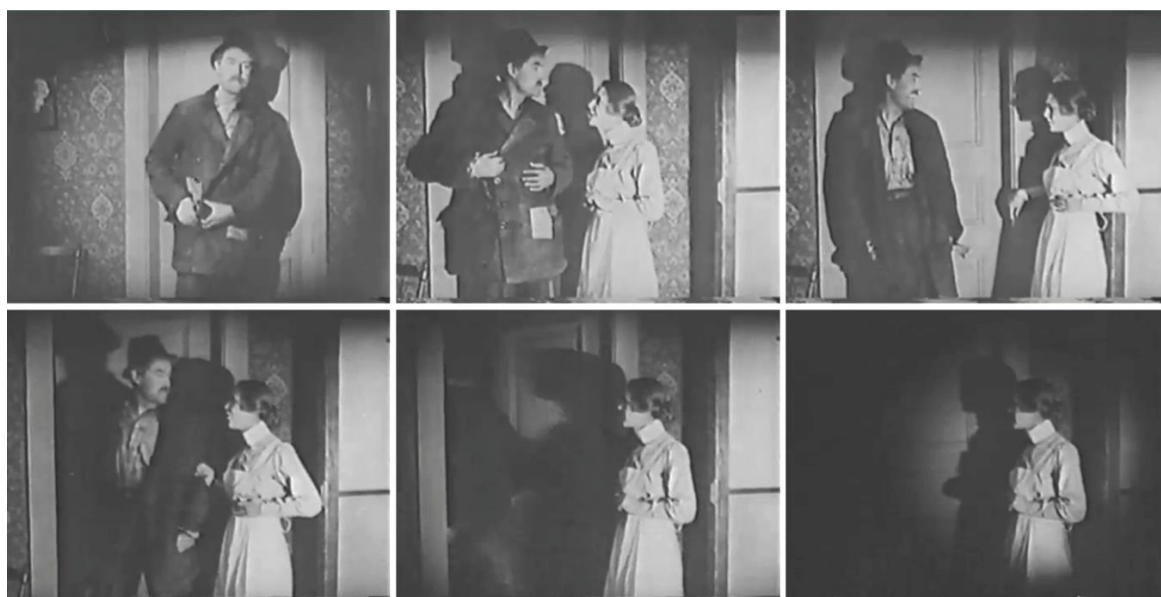
Figuras 1-6. Fotogramas del fragmento A.