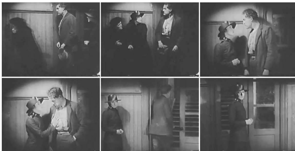
Figuras 7-12. Fotogramas del fragmento B.

tales). Holm desaparece por el sexto segmento (fig. 11), como antes, y Edit lo contempla a través de los cristales sin atreverse a abrir la puerta; esto es, ahora hay más distancia entre ellos, más capas en profundidad. Se queda sola, por segunda vez, y la sombra se balancea hacia la izquierda (fig. 12).