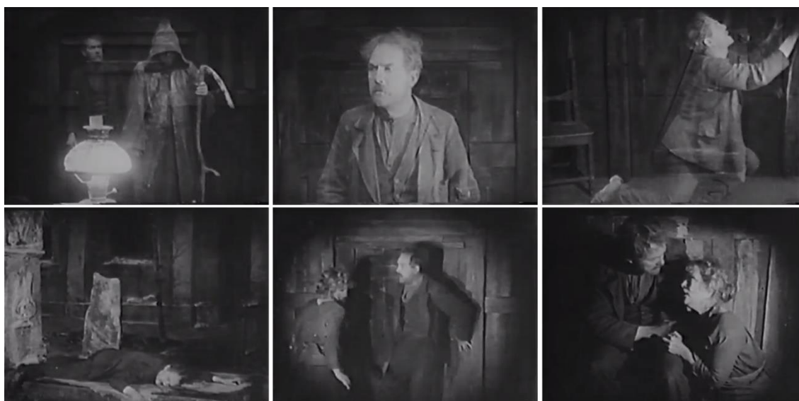
Figuras 19-24. Fotogramas de la escena final.