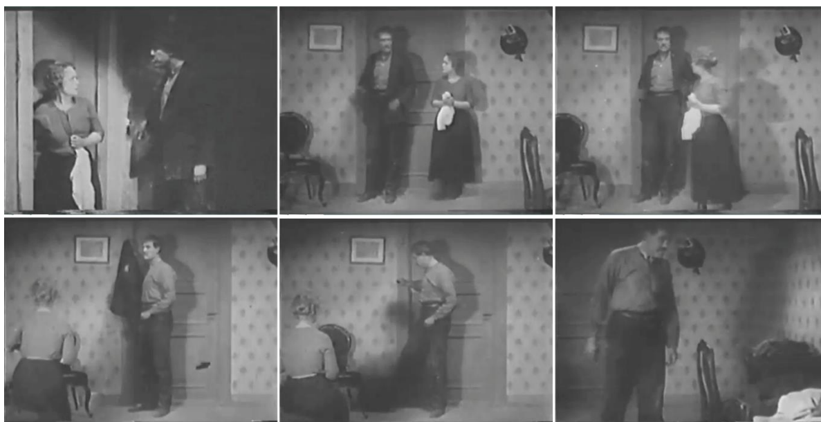
Figuras 13-18. Fotogramas del fragmento C.

se sentaba (fig. 17); es decir, en cierta manera la sombra femenina y el abrigo masculino se identifican en su caída al suelo, en su servilismo al hombre, y ello culmina con este último pateando el conjunto abrigo-sombra hacia el rincón (arrinconándolos). A continuación, Holm se aleja, a su vez, de la puerta, pero en esta ocasión la sombra sobre la pared se hace cada vez más grande y al llegar al rincón opuesto la difusión se concreta y se vuelve más nítida, una amenaza patente sobre los niños (fig. 18).